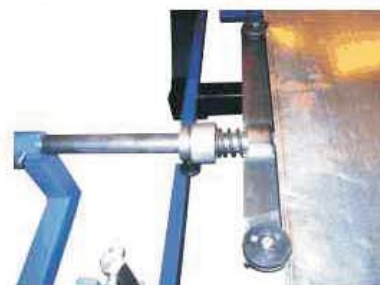
Detal bocznego docisku sprężynowego

określonej ilości blachy jest łatwa i dokładna. Maksymalna masa kręgu na podstawie z kółkami wynosi 3000kg, szerokość kręgu wynosi 1250mm. Ostatnim udoskonaleniem wyciągarki TK-1250a to boczny sprężynowy docisk, zapewniający zawsze kąt prosty poprzecznego odcięcia, którym eliminuje się niedokładne zwiniecie blachy w krąg i jego zmienną szerokość.